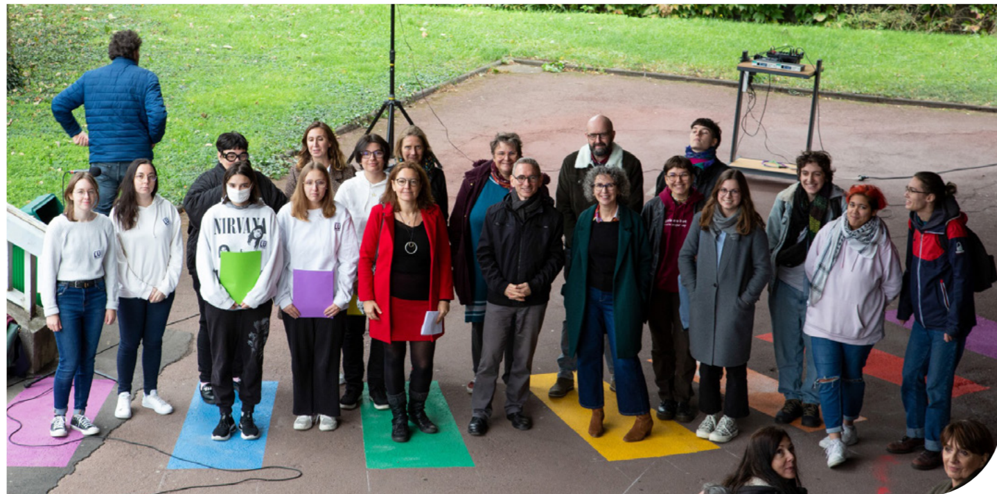
Novembre 2022 : inauguration d'un passage piéton arc-en-ciel sur le campus Gergovia en soutien à la lutte contre la LG-BTphobie.