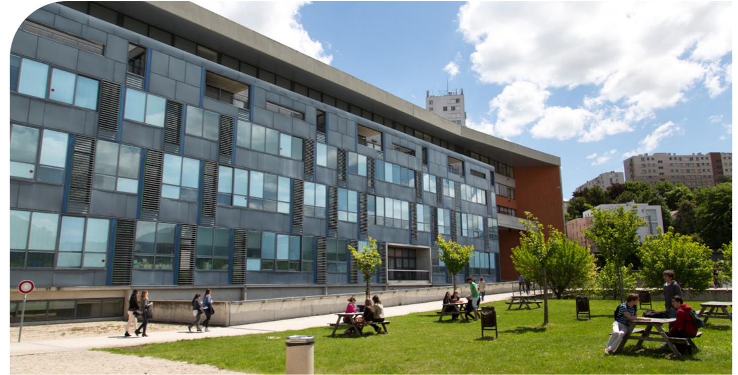
SCHÉMA DIRECTEUR DE LA VIE ÉTUDIANTE 2022-2026 : UN ENGAGEMENT COLLECTIF POUR AMÉLIORER LA QUALITÉ DE VIE ÉTUDIANTE

L'Université Clermont Auvergne, en partenariat avec le CROUS et les établissements de l'enseignement supérieur, s'engage à améliorer la qualité de la vie étudiante.