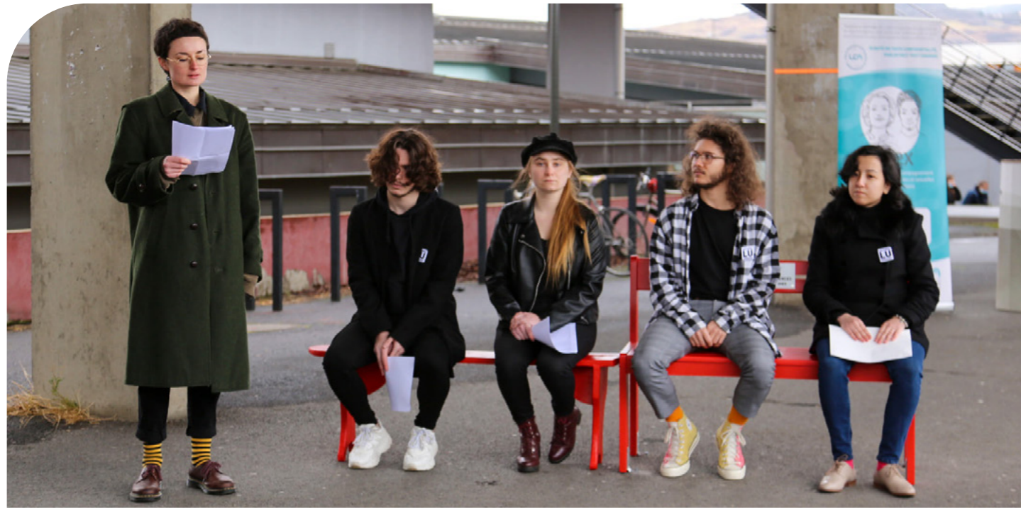
Février 2022 : inauguration du banc rouge installé place Vasarely, sur le Campus de Cézeaux, en « femmage » aux femmes victimes de violences