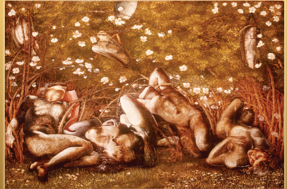
Illustration: Edward Burnes Jones, The Sleeping Knights