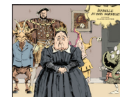
Isabelle au Bois Dormant Claude Coutier Sélection Festival Court métrage 2007 (sous réserve)

PROJECTION DE COURTS MÉTRAGES AUTOUR DU CONTE LA BELLE AU BOIS DORMANT LE 27 NOVEMBRE À 17 HEURES 30.