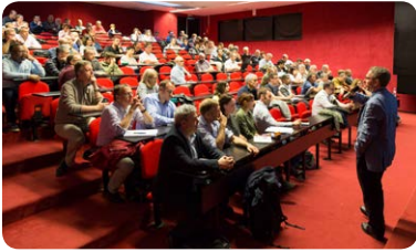
Assemblée Générale sur la structuration du site