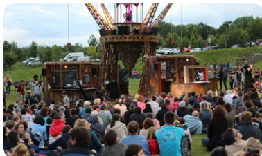
Inauguration des « Nuées Ardentes » au pied du Puy-de-Dôme