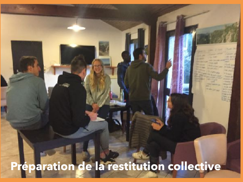
Préparation de la restitution collective