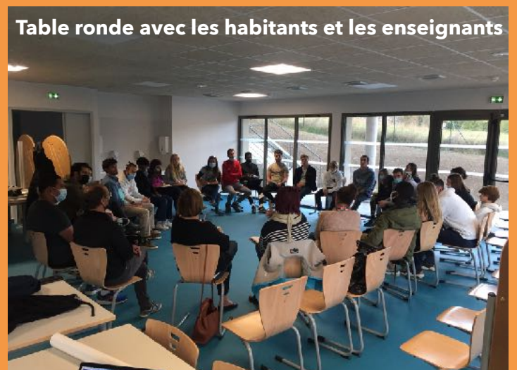
Table ronde avec les habitants et les enseignants