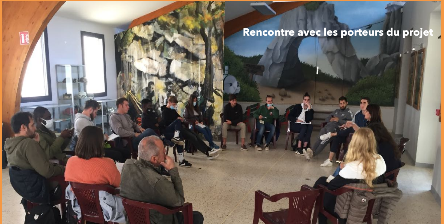
Rencontre avec les porteurs du projet

Projet d'intervention dans un territoire pour accompagner les structures récréatives dans leur projet de développement