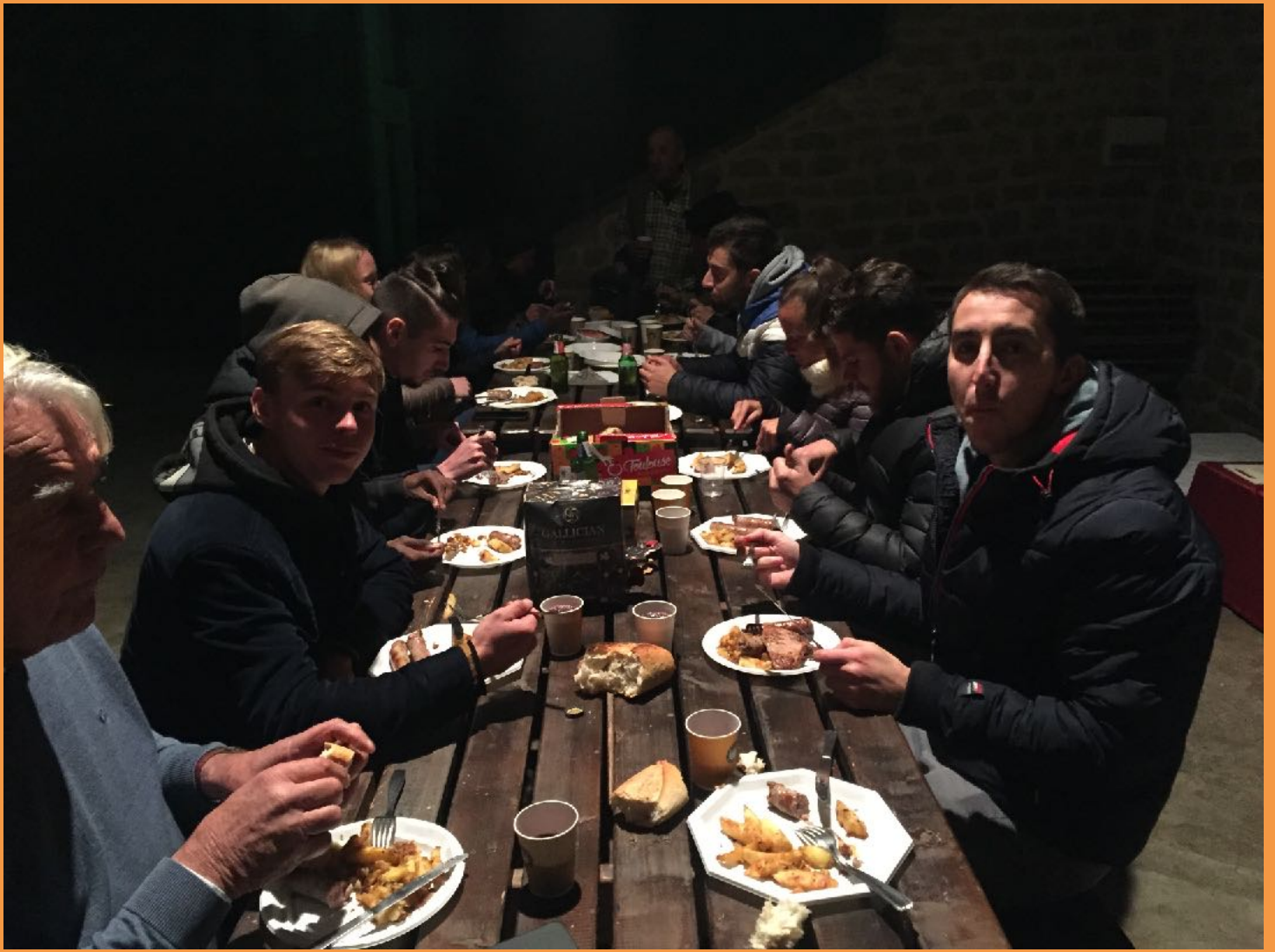
Moments de convivialité