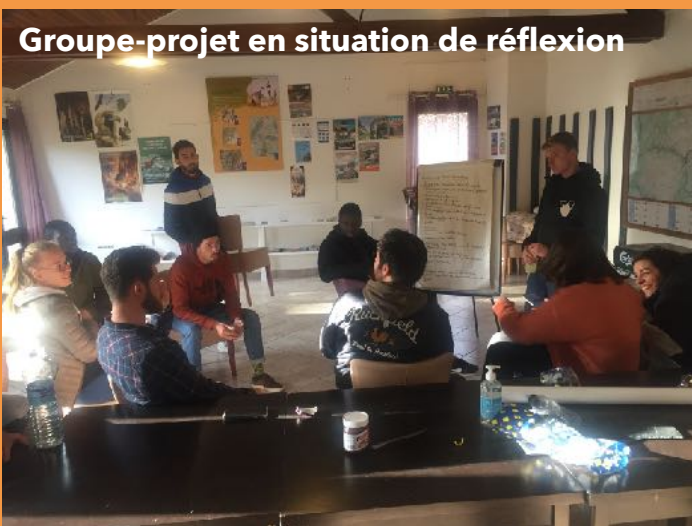
Groupe-projet en situation de réflexion