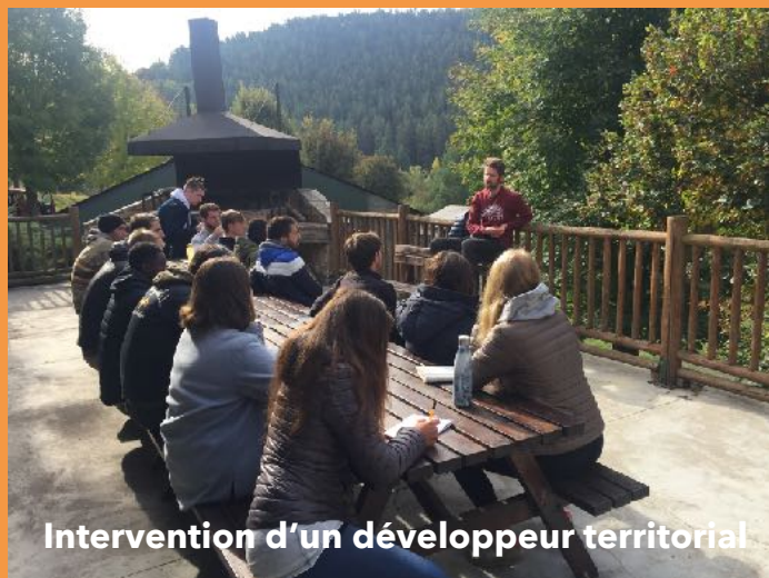
Intervention d'un développeur territorial