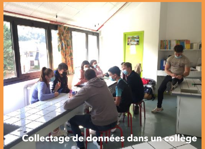
Collectage de données dans un collège