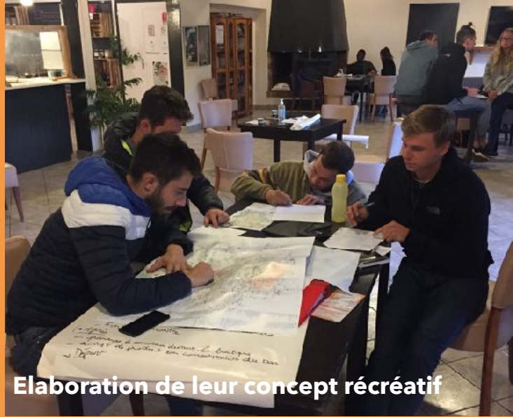
Elaboration de leur concept récréatif