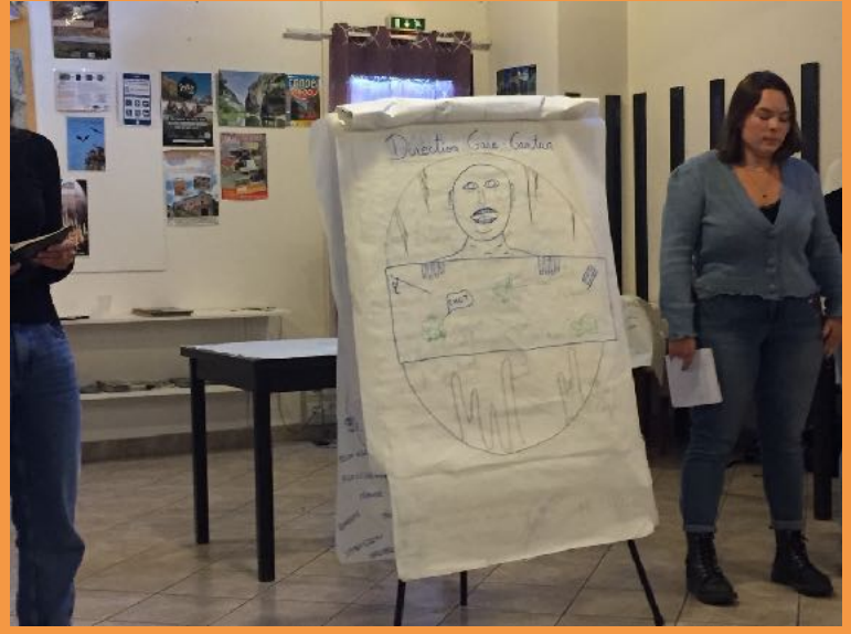
Restitution collective en fin de séminaire en présence de locaux et de l'entreprise