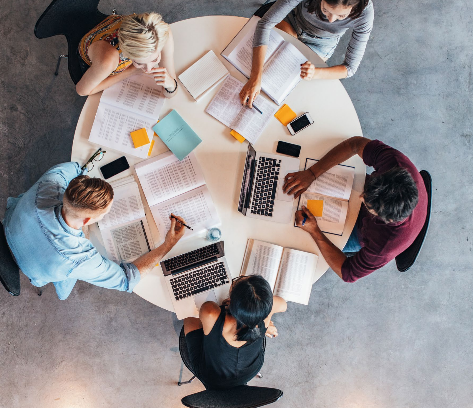
SCHÉMA DIRECTEUR DE LA VIE ÉTUDIANTE